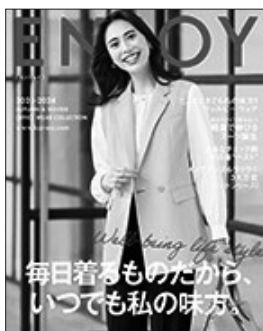
カーシー、セロリー、ヌーヴォー 事務服は各メーカー35%OFF