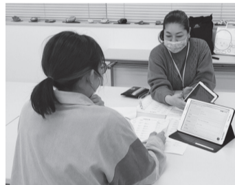
希望条件を確認する事務局

十和田市、五戸町で勤務経験あり。結婚、出産を機に退職。今年4月よりお子さんが小学校へ入学するため、復職を希望。土曜は午前のみ、平日は18時までの勤務が可能で、将来的にはフルタイム希望。18時～18時半までに帰宅できる範囲で勤務先を探している。院内見学を希望しており、連絡する際には、ご協力をお願いしたい。