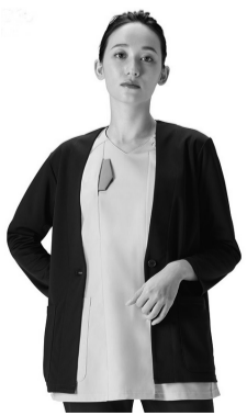
KAZEN KZN115-42, KZN115-49

カーディガン どんなデザインにも組み 合わせやすいVネック カーディガンが人気です